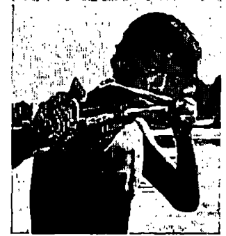
• Nezhnost », de Agio Ishanchoghzaev

num vocal, et de quelques partis pris de mise en scène : une caméra continuellement en mouvement, la répartition équilibrée des voix, un final chanté au « public ». « Wild 90 » constitue une sorte de pendant de « The Brig » de Mekas : partant des mêmes présupposés — unité de lieu et de temps, caméra au poing, récitatif exaspéré — il obtient des effets différents : sentiment d'angoisse totale et paralysante pendant la projection de « The Brig », et indifférence après coup. L'inverse pour le film de Mailer. Comme, dans les souvenirs, la voix triomphe du geste ?